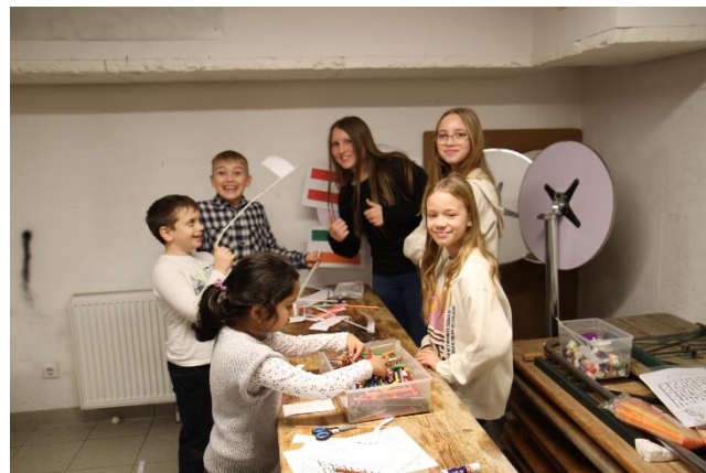
Kinder beim Basteln der Fahnen. Unsere Firmlinge übernehmen die Kinderbetreuung.