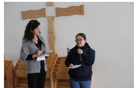
Voller Pfarrsaal bei den Präsentationen und gemeinsamen Austausch.